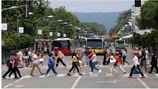
Slika 2. Urbana mobilnost. Stil 'Slike natpis'